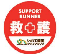
救護サポートランナー用ステッカー

(2)ケガや体調不良の選手を発見した場合には、選手に声を掛け、状態を確認し、最寄りの競技役員(走路員)・救護スタッフと連携し必要な処置を行います。